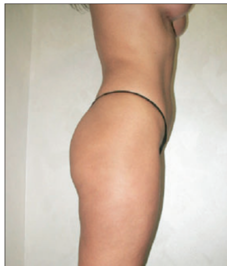
Izgled tela posle intervencije

Postupak liposukcije bio je dopunjen i davanjem mezoterapijskih koktela s phosfatidincholinom , preparatima artičoke i silikata, koji su postoperativno uzrokovali dalje razbijanje masnih ćelija i uticali na obnavljanje elastičnih vlakana u koži, što je uzrokovalo njeno brže i bolje zatezanje.